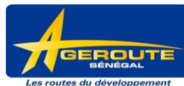
Agence des Travaux et de Gestion des Routes du Sénégal