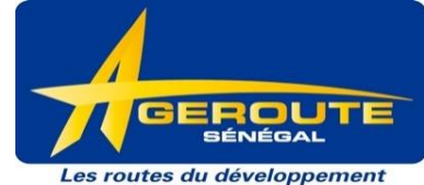
Agence des Travaux et de Gestion des Routes du Sénégal