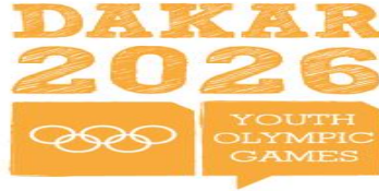
Comité d'Organisation des Jeux Olympiques de la Jeunesse 2026